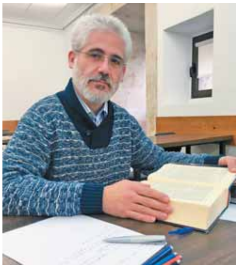
Francisco en la Universidad Pontificia de Salamanca

—Siento que este día no es sólo un día para los seminaristas, es un día para y de toda la diócesis, para que todos, cada uno desde sus comunidades parroquiales de gracias a Dios por el don maravilloso de las vocaciones que suscita y para que reemos los unos por los otros y en especial por todos aquellos que sienten esta llamada y no se atreven a dar el paso,