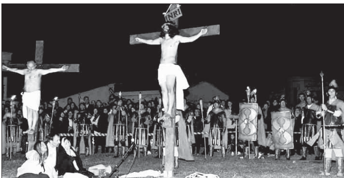
Escenificación por las calles de Malpartida

Con la llegada de la Semana Santa se ha preparado con ilusión, en la parroquia San Juan Bautista de Malpartida de Plasencia, la representación de las últimas horas de vida de Jesús.