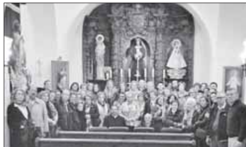
La iglesia de San Gregorio albergó el retiro

Finalizó la jornada con café y dulces, ofrecidos por los cofrades de Guareña, en un ambiente de hermandad. ■