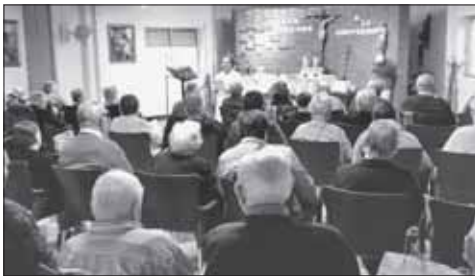
La reforma ha conseguido un espacio para estar más cerca de Dios res acompañamiento espiritual y pastoral así como facilitarles la práctica de sus creencias religiosas, y en este compromiso parti-