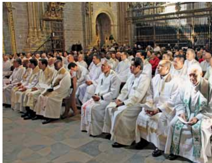
Los presbíteros renovaron sus compromisos sacerdotales