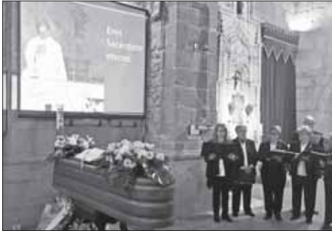
El funeral fue en El Salvador donde sirvió durante cuarenta años comunidad viva, trabajando para que el mensaje del Señor llegara a cada corazón de los que forman esta comunidad parroquial". Su ordenación sacerdotal tuvo lugar en la capilla de la Universidad Pontificia de Comillas, en Santander. Junto a 28 seminaris-