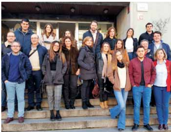
Parte del profesorado del colegio

tamiento de Don Benito, en nombre de toda la ciudad, agradeció (y