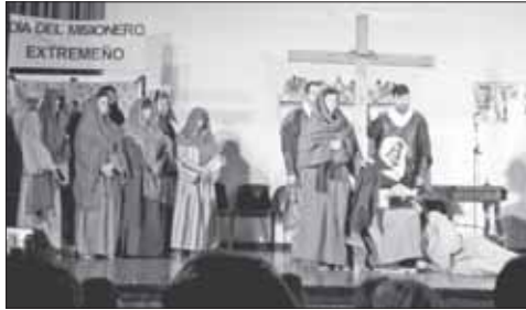
Representación de la Pasión por el grupo Siembra, en el Día del Misionero Extremeño.

Los participantes fueron acogidos, en una mañana muy lluviosa,