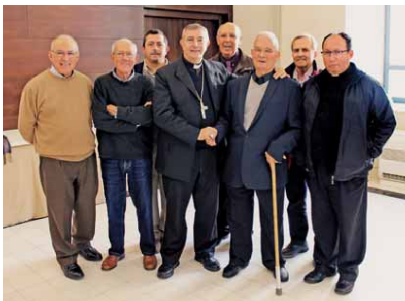
El Obispo junto a los homenajeados en el Seminario

Algunos dirán que ha sido casualidad, yo me inclino por ver más la mano sutil de la Providencia. La cuestión es que los homenajeados este año en la fiesta de bodas de oro y plata sacerdotales son y han sido, por vocación y por opción, "curas de pueblo" toda su vida ministerial, sacerdotes dedicados en cuerpo y alma a las personas, a las inquietudes y las preocupaciones de las gentes rurales para llevarles a Jesús como fuente de felicidad y sentido para la vida. Ordenados en el mítico 68 del siglo pasado, se convirtieron en una extraordinaria añada de generosidad y arrojo para extender en nuestra diócesis la llama de renovación eclesial y apertura al mundo que el Espíritu había prendido en el Concilio Vaticano II. Quienes los hemos tratado y admirado, a todos y cada uno de ellos, sabemos que el único motivo, la única razón de su existencia, de su irrevocable permanencia a lo largo de los años en lugares no siempre confortables humanamente, ha sido su arraigada e inquebrantable espiritualidad en el seguimien-