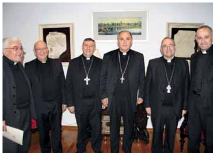
Obispos y vicarios generales de la provincia eclesiástica