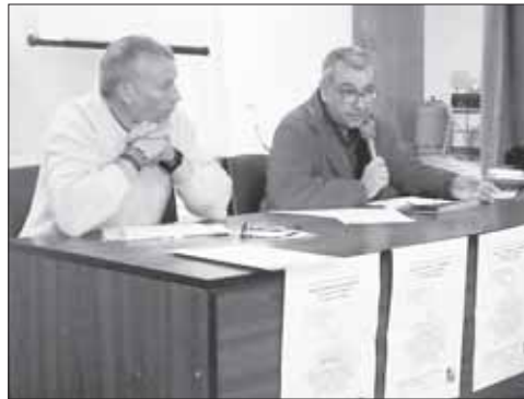
Se presentó una alternativa al modelo económico actual

Tras la asamblea y el descanso para comer se celebró la eucaristía para finalizar las jornadas. ■