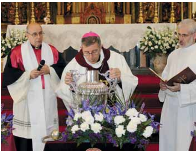
El obispo bendijo los óleos y consagró el Crisma