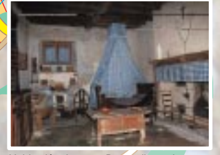
Habitation de santa Bernardita en la casa de su nodriza en Bartrès, llamada casa Burg.