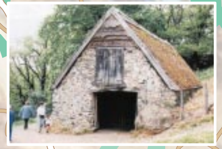
La granja de Bartrès.